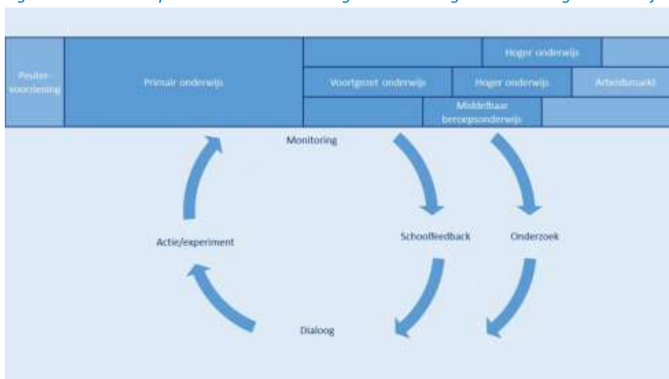
Figuur 2: Structureel proces van samenwerking en monitoring in het Limburgse onderwijs

De primaire doelstelling van de EAL is het bevorderen van de dialoog en samenwerking tussen alle partijen die betrokken zijn bij het onderwijs in Limburg, om zo het onderwijs verder te verbeteren en te zorgen voor een efficiënte aansluiting van dat onderwijs op de Limburgse arbeidsmarkt. De betrokken partijen zijn de scholen, schoolbesturen en kennisinstellingen in Limburg, maar ook andere partijen die een rol spelen, zoals het bedrijfsleven, de GGD, de gemeenten, de Provincie Limburg, en andere instellingen. Door een structurele dialoog en samenwerking wordt de beschikbare kennis en – vaak complementaire– expertise van de verschillende spelers in het onderwijsveld optimaal benut en omgezet in concrete initiatieven waarmee wordt nagegaan wat wel en wat niet werkt als onderwijsverbetering. Dit gebeurt op een continue, cyclische manier (figuur 2) waarbij ook steeds de juiste gegevens worden verzameld die nodig zijn om projecten te evalueren en het benodigde beeld te krijgen hoe het onderwijs ervoor staat. Belangrijk is overigens dat de dialoog op verschillende niveaus plaatsvindt, niet enkel op bestuursniveau. Het doordringen tot de verschillende lagen binnen het onderwijs is geen eenvoudige opgave en vereist een intensieve fase van verkenning van elkaars wereld en het leren spreken van elkaars taal. Deze verkenning vindt momenteel plaats en uit zich al in enkele concrete samenwerkingsverbanden.